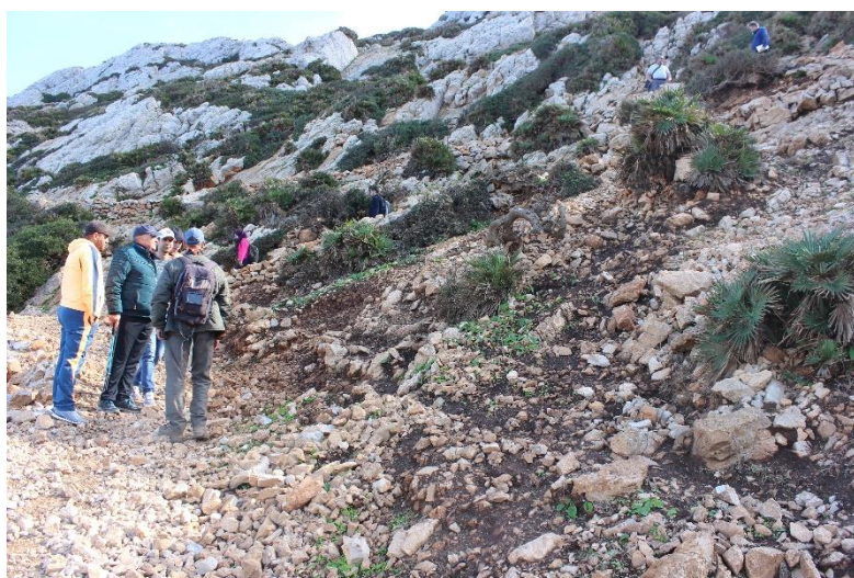
Zone dégradée par le ravinement à protéger par des gabions

En revanche, certaines parois jouxtant le sentier montrent des signes avancés d'érosion menaçant l'intégrité du sentier. Une mise en place de gabion sur ces sections permettra de limiter l'érosion et de favoriser l'ensemencement du sentier.