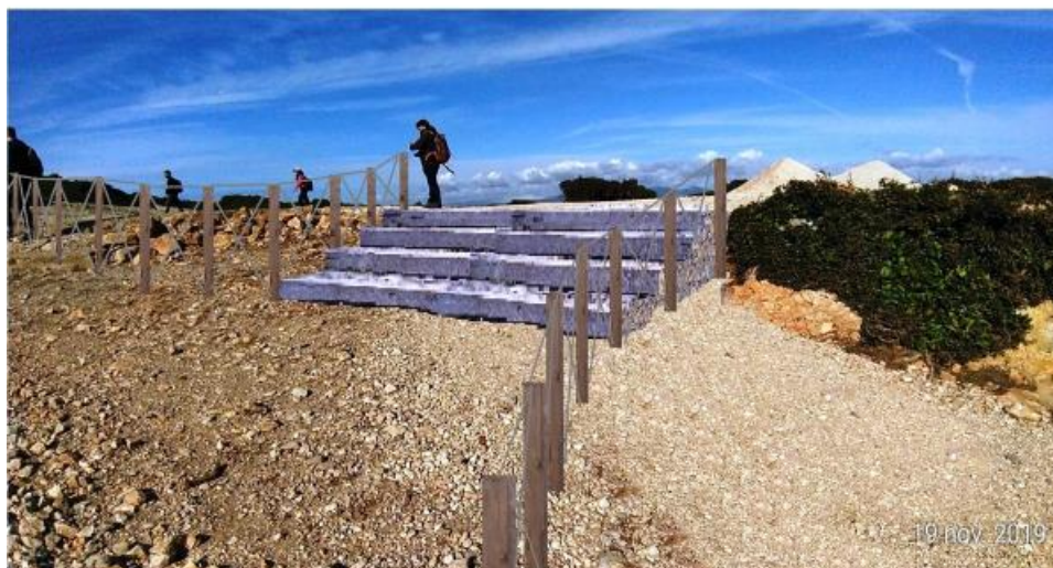
Escalier permettant d'accéder plus aisément au bunker

Pose de gabions coussins fait grillage de poulailler et de pierres locale, l'ensemble relié aux piquets bois de l'entrée.